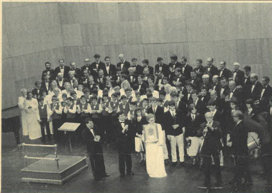
Uno de los últimos conciertos del Coro easo en el Teatro Victoria Eugenia donde se homenajeó al Coro Maitea.